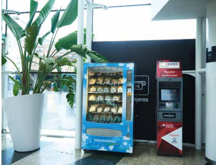
Aeropuertos, estaciones de autobus, tren, ...