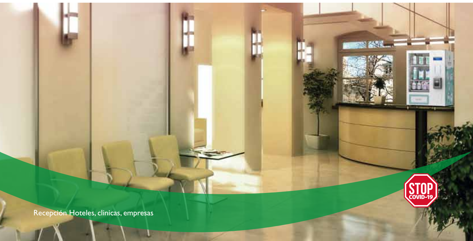
Recepción Hoteles, clinicas, empresas